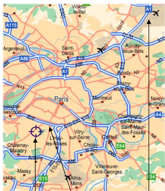
Châtillon-Montrouge Roissy CDG Airport South Ring

From Roissy CDG Airport and from "Gare du Nord": Taxi could be long and expensive during traffic jam times. Take RER B (Fast tube), the Blue line to the South, direction "Robinson" or "St Remy Les Chevreuses", until the "Denfert Rochereau" station. Then either you take a taxi (15 minutes) or you take the tube (Metro), Line 6 direction "Charles de Gaulle Etoile", stop at "Montparnasse Bienvenue", then take Line 13 to the south, and stop to the terminus "Châtillon Montrouge". Take the right station exit, and go straight by walk on "La Coulée Verte" during 5 minutes until a traffic light. Cross the street and you arrive on Pierre Sémard Street. MEDIALON is located in the first building on your right, on the 2 nd floor.